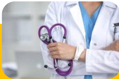
Veselība, ekonomiskā, sociālā un institucionālā noturība