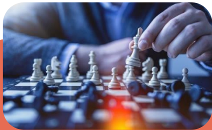
Vieda, ilgtspējīga un iekļaujoša izaugsme