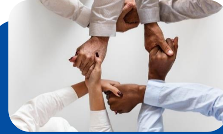
Sociālā un teritoriālā kohēzija