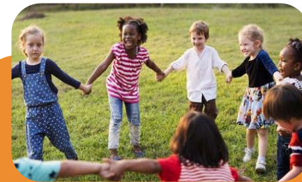
Atbalsts nākamajām paaudzēm