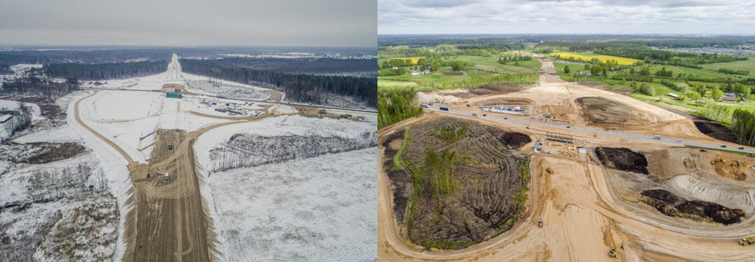
Ķekavas apvedceļa un Rīgas apvedceļa mezgls